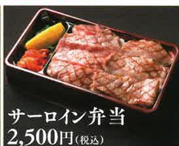
サーロイン弁当 2,500円(税込)