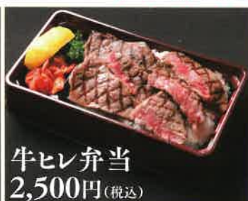
牛ヒレ弁当 2,500円(税込)