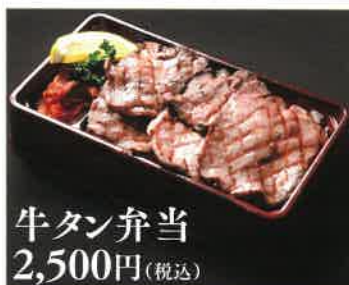
牛タン弁当 2,500円(税込)