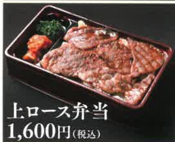
上ロース弁当 1,600円(税込)