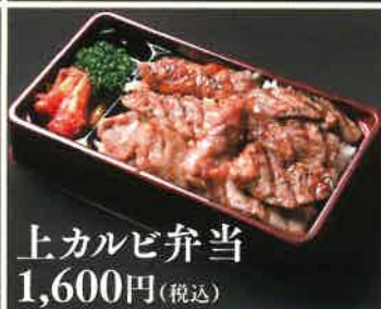
上カルビ弁当 1,600円(税込)