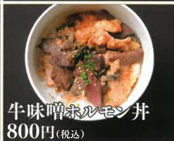
牛味噌ホルモン丼 800円(税込)