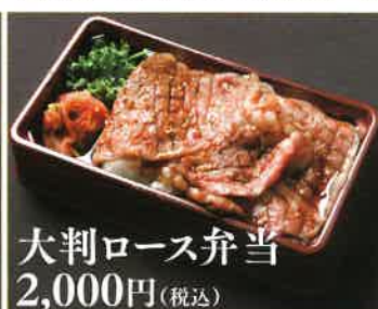
大判ロース弁当 2,000円(税込)